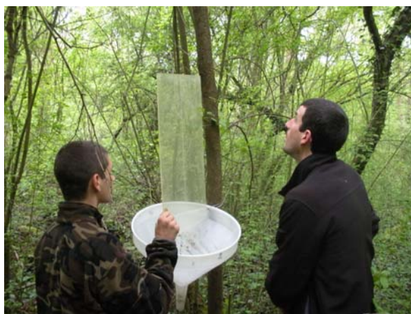
pose de pièges d'interception